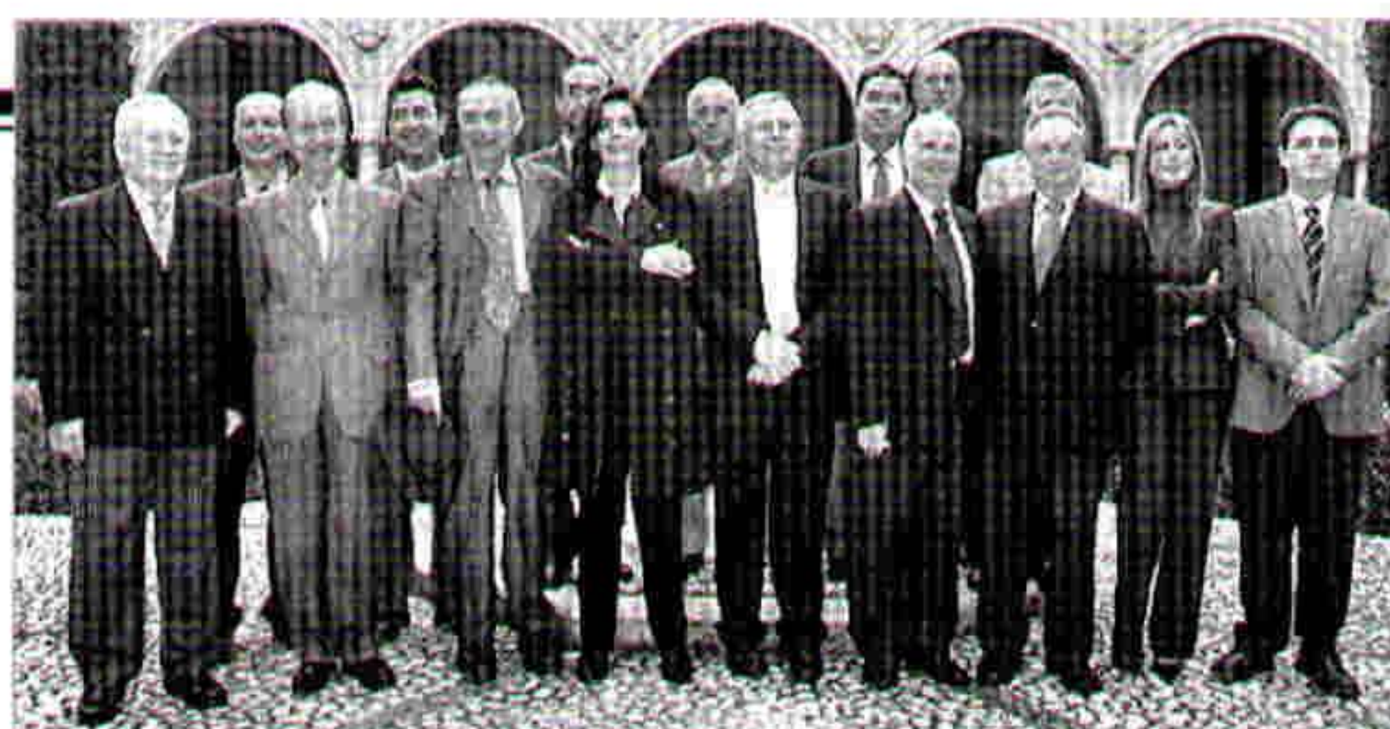
La Cátedra es fruto de un convenio con la Fundación Cajamurcia, la Asociación Murciana de la Empresa Familiar, el Instituto de la Empresa Familiar y la UMU