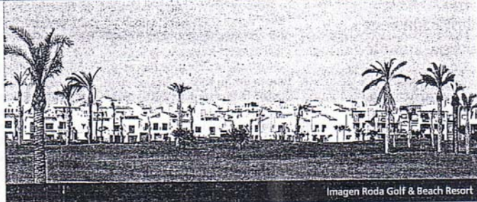
Imagen Roda Golf & Beach Resort