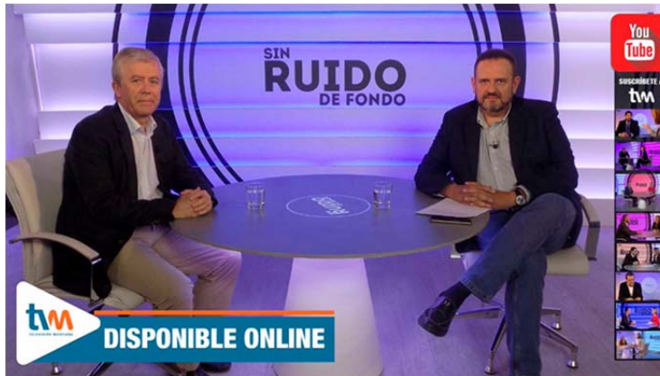
Sin Ruido de Fondo | Ángel Meroño 15 jul. 2019 Televisión Murciana